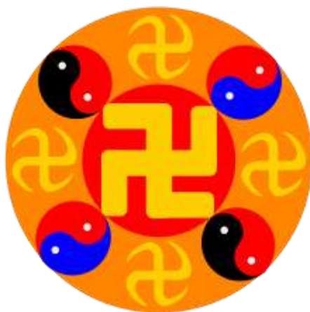
Obr. 1: Kolo Zákona (wikipedia.org).

vyplňuje zlatožlutá levotočivá svastika 18 . Oranžový kruh v sobě spojuje symboly škol, z nichž metoda vychází – čtyři zlatožluté svastiky představují učení buddhismu a čtyři znaky jinu a jangu sjednocují prapůvodní (červeno-modrý symbol) a současnou filosofii taoismu (červeno-černý symbol). Barva pozadí Kola Zákona (vyjma střední části a jednotlivých symbolů obou škol) se cyklicky mění z červené v oranžovou, žlutou, zelenou, modrou, indigovou a fialovou 19 . Tyto změny se dějí v jiné dimenzi a někteří praktikující je mohou vidět skrze otevřené třetí oko (Li 2006).