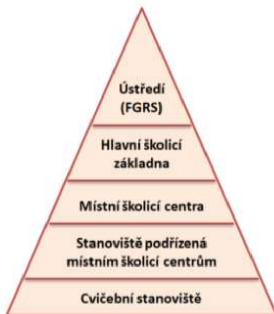
Obr. 2: Pyramidální struktura „hnutí“ Falun Gong (Palmer 2007, s. 197).

klamoval, že Falun Gong je pseudovědeckým hnutím podporující pověry a jeho zakladatele označil za podvodníka, jenž svým učením odpírá lidem základní lékařskou péči 74 (Junker 2014). V listopadu byl na žádost Liho zástupců v Číně Falun Gong vyřazen z China Qigong Research Society 75 kvůli ztrátě zájmu vlády a rostoucímu vlivu administrativních regulací ze strany státu (American Sociological Association 2016). V roce 1997 byla Výzkumná společnost pro Falun Dafa formálně rozpuštěna a tím zanikla i její víceúrovňová organizační struktura 76 (Tong 2002). Strana ovšem byla přesvědčena, že „hnutí“ Falun Gong je i nadále centrálně řízeným hierarchickým systémem s přímými vazbami na Liho, který pyramidální strukturu hnutí vytvořil (obr. 2 a obr. 3) a ze zámoří svému „loutkovému režimu“ dává příkazy, jež pekingské ústředí (Výzkumné společnosti pro Falun Dafa) přenáší na nižší správní úrovně (Hongyan 2001).