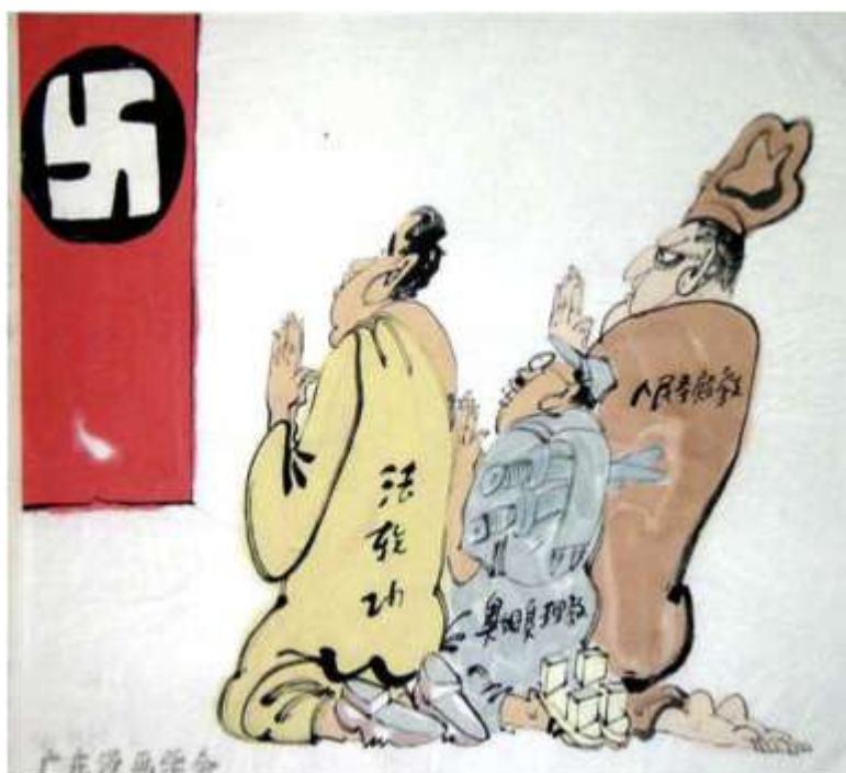
Obr. 4: (zleva) Praktikující Falun Gongu a členové sekt Óm šinrikjó a Chrám lidu společně se modlí k symbolu pravotočivé svastiky (Weihsuan 2018, pozn. z osnov střední školy v Nan-chaji).

kulticky vzývaného vůdce fanatického hnutí (např. v roce 1978 více než 900 členů americké sekty Chrám lidu uposlechlo výzvy svého zakladatele Jima Jonese a vypilo kyanidový koktejl v guyanské osadě Jonestownu 98 ), ale i k destruktivním útokům sekt na nevinné obyvatelstvo (např. vypuštění sarinu v tokijském metru stoupenci sekty Óm šinrikjó v roce 1995 99 ). Komunistická strana Falun Gong v některých výročí přirovnávala dokonce k teroristické organizaci, a pokud by ji tak vnímaly i mezinárodní instituce a vlády zemí, v nichž se diaspory praktikujících nachází, měly by být povinny těmto lidem odepřít bezpečná útočiště (Edelman a Richardson 2005).